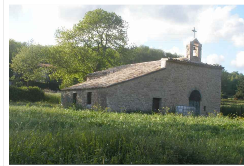
Chiesa di Ambrifi